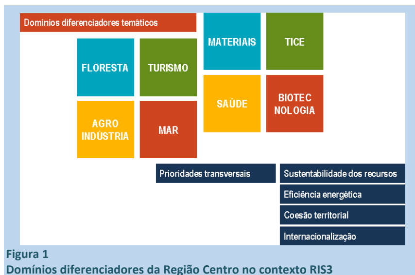
Figura 1 Domínios diferenciadores da Região Centro no contexto RIS3

O processo de auscultação dos agentes regionais conduziu à identificação de mais quatro prioridades transversais, de natureza distinta: a sustentabilidade dos recursos, a eficiência energética, a coesão territorial e a internacionalização. Estas três dimensões são transversais, e correspondem a prioridades da Região Centro que importa considerar em sede de especialização inteligente (figura 1).